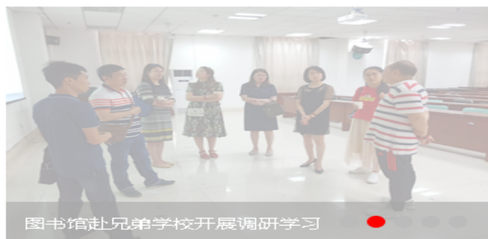
图书馆赴兄弟学校开展调研学习