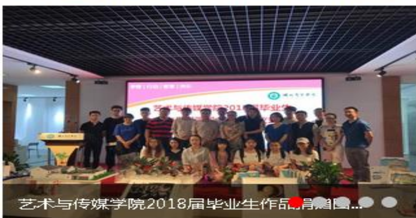
艺术与传媒学院2018届毕业生作品... 更多